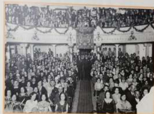
Interior del Teatro Isabel la Católica. 1929.

Es entonces, en estos años próximos al cambio de siglo, cuando habría que fijar la llegada de los